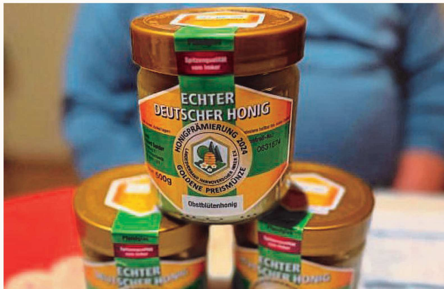
Die Bienen sammeln den Nektar auf den Obstwiesen im Alten Land.

Als vor etwa 25 Jahren in der direkten Nachbarschaft ein Imker gestorben ist, fragte sich Sander, was aus den Bienen werden soll. Er ging zu den Angehörigen und kaufte ihnen kurzerhand die Bienenvölker ab. Dabei gab es jedoch einiges zu beachten. Nachdem er die Kisten gekauft hatte, brachte er sie für zwei Wochen zu einem Bekannten, doch die Zeitspanne war zu kurz. „Abends kam ich zu den Bienen und es waren keine Bienen mehr da. Die hingen alle am Dach des Nachbarhauses“, erklärt Sander schmunzelnd. Anschließend musste er sein Volk dort wieder „abfegen“ und nach Hause bringen. „Dann habe ich sie für drei Wochen wieder weggebracht und es war gut.“ Bienen fliegen übli-